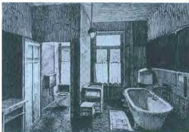
Appartements des Salinenhotels im Park