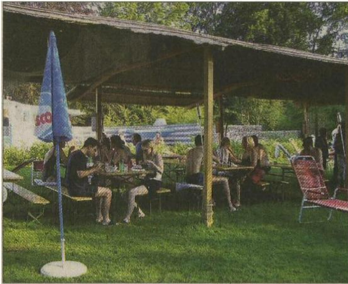
SUMMER NIGHTS Feriengefühl nach Feierabend.

Auch im Sommer ist Wellness ein echter Plausch