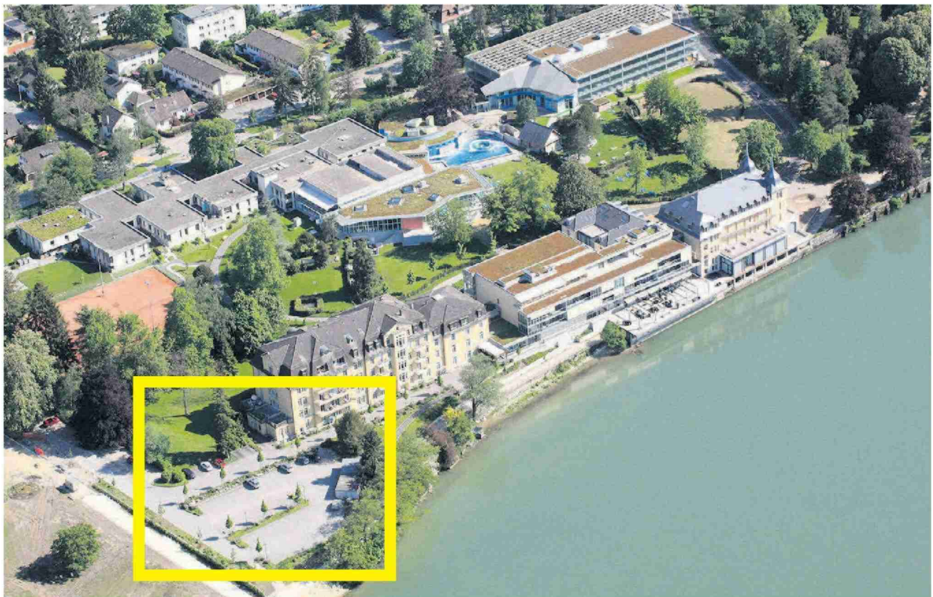
Auf dem heutigen Parkplatz beim Park-Hotel könnte in den kommenden Jahren ein neues Gebäude realisiert werden.

Parkresort-Gruppe mit weniger Umsatz und weniger Gewinn