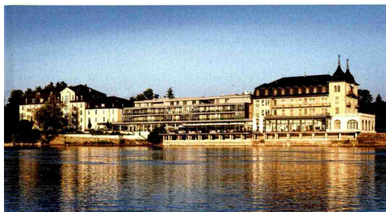
Park-Hotel am Rhein: Oase des Wohlbefindens am Flussufer.