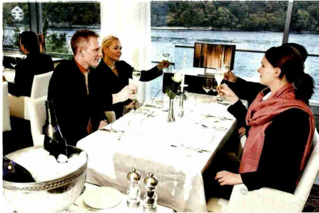
Gaumengenüsse im Restaurant Bellerive mit Blick auf den Rhein.

Themen-Nr.: 516.017 Abo-Nr.: 516017 Seite: 28 Fläche: 84'216 mm 2