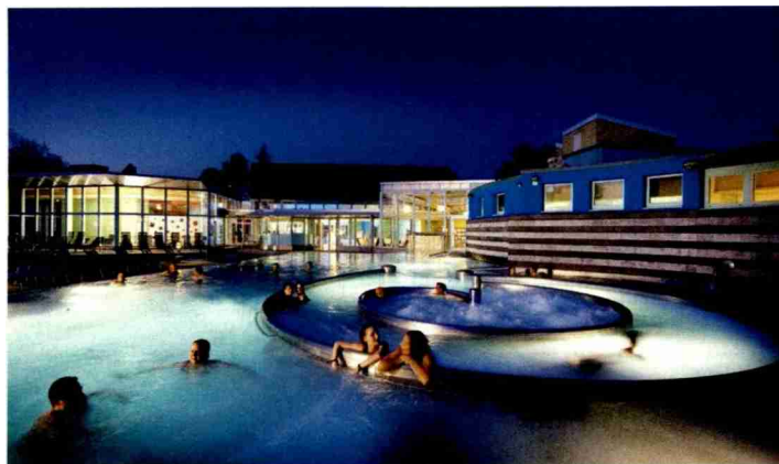
Das Aussenbecken des «sole uno» als besonderes Erlebnis «by night».