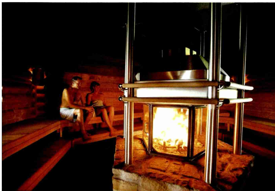
Im Bann des flackernden Feuers schwitzen und entspannen.

Nicht verpassen sollten die Gäste des Park-Hotels einen Besuch des charmanten, ältesten Zähringerstädtchens der Schweiz, das nur wenige Minuten zu Fuss entfernt liegt. Mit seinem mittelalterlichen Stadtkern, den verwinkelten Gassen, den mit Fresken verzierten Fassaden, Torbögen und Türmchen zeugt es von einer reichen Vergangenheit. Kulturinteressierte finden in der Nähe viel Sehenswertes, unter anderem in der Römerstadt Augusta Raurica oder der Kulturmetropole Basel. Auch die landschaftlich reizvolle Umgebung von Rheinfeldern bietet vielfältige Freizeit- und Erholungsmöglichkeiten – von Spaziergängen am Flussufer über Wanderungen auf dem Fricktaler Höhenweg hin zu Veloausfahrten über die Hügelzüge des Aargaus.