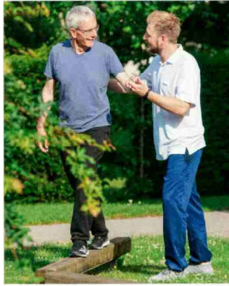
Die intensive Physiotherapie in der Kur führt effizient zurück zur grösstmöglichen Mobilität.