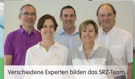
Verschiedene Experten bilden das SRZ-Team.

Der C-Bogen ermöglicht die millimetergenaue Lokalisierung von Schmerzpunkten.